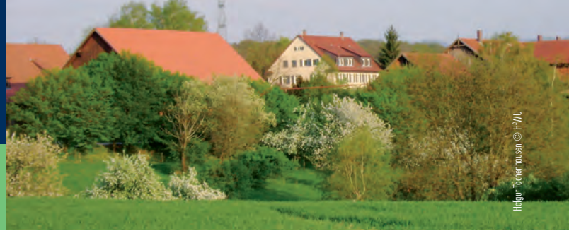
Heinrich Tachenhausen © HFUW

Streuobstwiesen sind eine Besonderheit unserer Region – aber wie kam es dazu? Und wie sieht die Zukunft dieses Agrarökosystems aus?